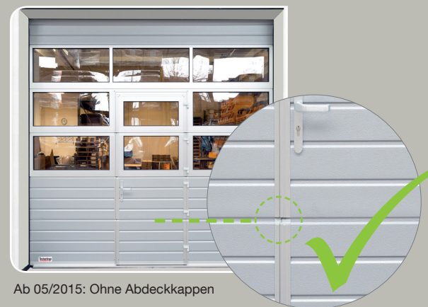
Ab 05/2015: Ohne Abdeckkappen

Das lichte Durchgangsmaß für Schlupftüren der CarTeck-Sectionaltore liegt ab sofort bei ca. 855 mm. Das variable Maß für Industrietore finden Sie in unserem Online-Konfigurator unter www.teckentrup.biz .