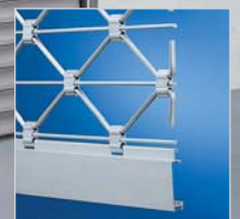
Rollgitter TG-X „easy“