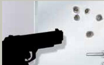
Beschusshemmende Tür Klasse FB 4, geprüft nach DIN EN 1522.