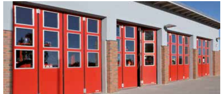
Feuerwehr-Falttor mit Schnellentriegelung.

Das Programm der Teckentrup Falttore ist kompakt und systematisch aufeinander abgestimmt. Ob einwandig oder doppelwandig, für jedes Tor gilt: gleiche Anschläge und gleiche Beschläge. Auf alle betrieblichen Erfordernisse individuell ausgerichtet, kommen Teckentrup Falttore besonders in großen Wartungshallen, Betriebshöfen, Gerätehallen oder Fahrzeugdepots zum Einsatz. Zur Auswahl stehen auch Tore mit elektrischem Antrieb, wenn Schnelligkeit gefordert ist, sowie mit Schnellentriegelung, speziell für Feuerwehren. Das technisch ausgefeilte Torkonzept ermöglicht Falttore bis zu 16 Meter Breite und 5 Meter Höhe.